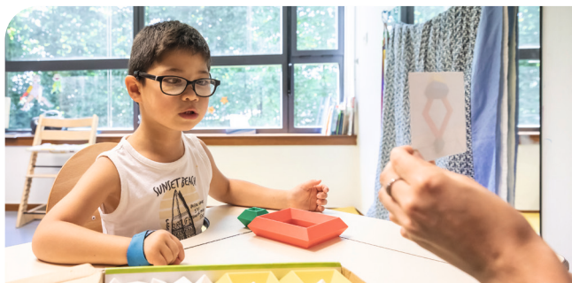
Schéma national d'organisation sociale et médico-sociale 2021-2025