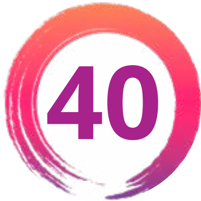
Figure 1. Les 40 actions ciblées pour l'intégration du handicap réparties en 10 points d'entrée stratégiques