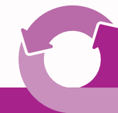
Figure 2. Cadre permettant de faire progresser l'équité en matière de santé pour les personnes handicapées grâce aux soins de santé primaires