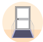
Rampe d'accès extérieur