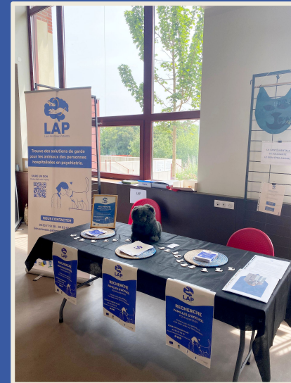
Journée de la Santé Mentale