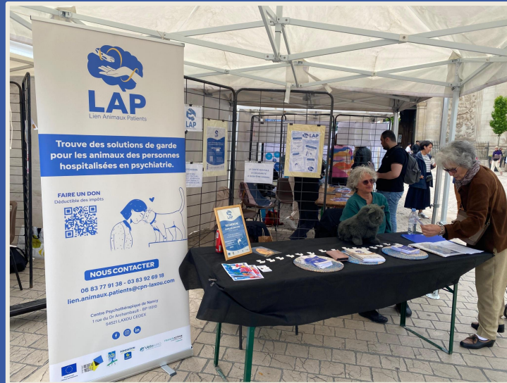
Village de la Santé Mentale

Participation à des événements Outil de médiation soignant-patient Interventions en structures de soins