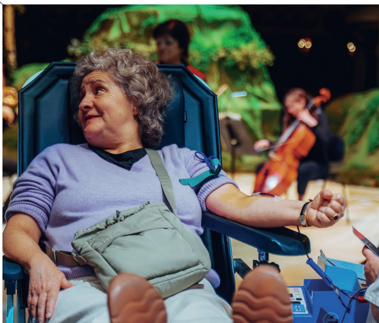
Janvier de la solidarité 2025 - Don du sang en musique