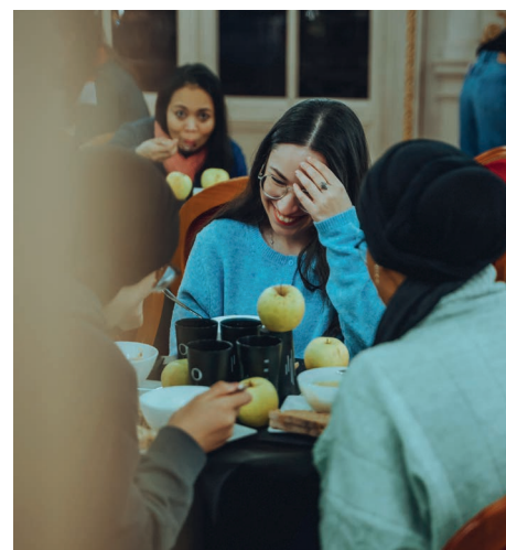
Janvier de la solidarité 2025 - Repas solidaire et concert du Chœur communautaire, en faveur des étudiant-e-s en situation de précarité