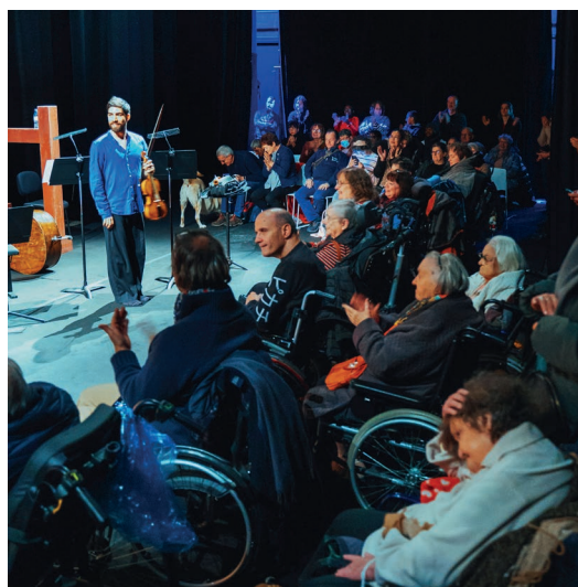
Janvier de la solidarité 2025 - Rencontre musicale avec l'Ensemble Cappella Mediterranea auprès du public PMR