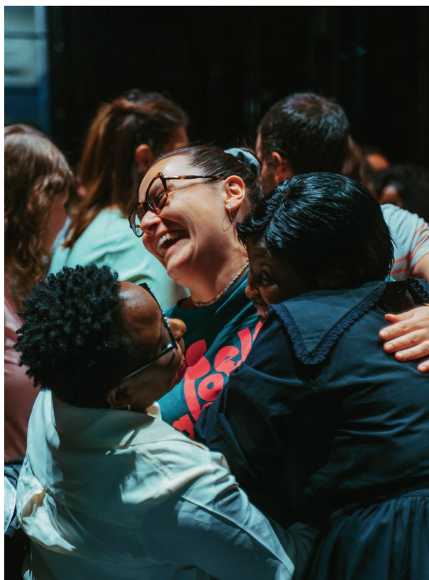
Concert du Chœur communautaire - mai 2025